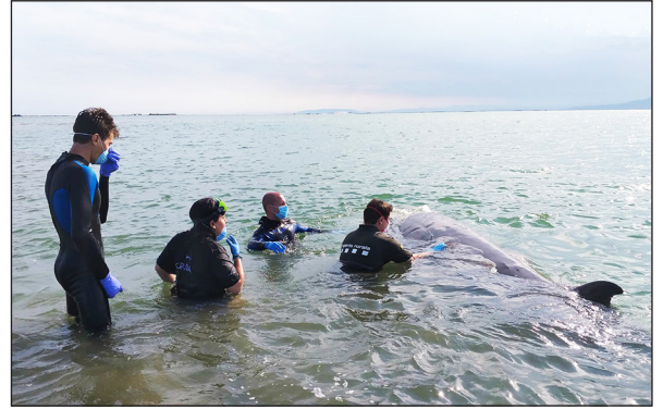
▲ Rescat de la balena.

Què va passar amb una balena? | Qui la va rescatar? | Què fas o faries tu quan et trobes un animal malalt o amb problemes? Per què?