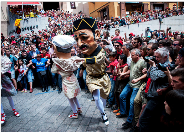
▲ Salt de lluïment dels Nans Nous

La ciutat de Berga celebra cada any la Patum, una gran festa amb més de 600 anys d'història i que tots els berguedans viuen amb molta emoció i alegria.