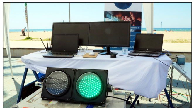
▲ Semàfor i pantalles per controlar l'afluència a les platges de Salou.

Què passarà a les platges a la fase 2? | Com ha solucionat l'Ajuntament de Salou el control de l'aforament? | Creus que aquest estiu anirem a la platja més, menys o igual que altres estius? Per què?