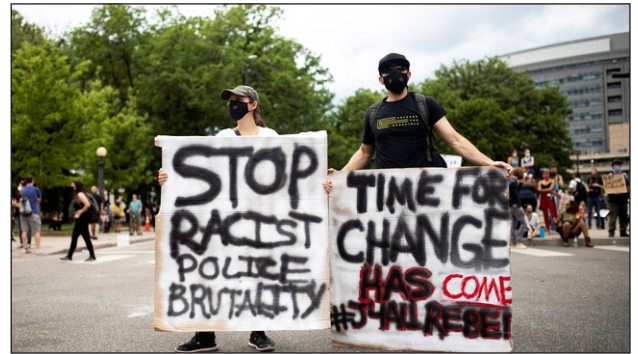
▲ Manifestants reclamen la fi de la brutalitat policial.

Què ha passat a Minneapolis? | Què critiquen les manifestacions que han tingut lloc als Estats Units? | Entre els famosos que rebutgen aquest cas i entre les persones que van a les manifestacions també hi ha gent blanca. Penses que és un bon senyal? Per què?