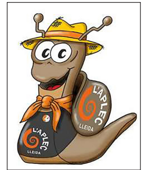
▲ Hèlix, la mascota de l'Aplec

CM Més informació: https://bit.ly/2Z0mg6H