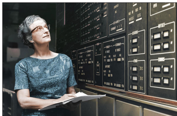
▲ Nancy Roman quan treballava a la NASA

Al conjunt de Lego «Dones de la NASA», una de les dones és Nancy G. Roman, una científica astronoma que va treballar durant molts anys a la NASA. Roman va planificar un telescopi fora de l'atmosfera terrestre que permetés als astrònoms estudiar millor l'espai sense les interferències de la Terra. Així va néixer el telescopi espacial Hubble i, per aquest motiu, la NASA va anomenar Roman com «la mare del Hubble».