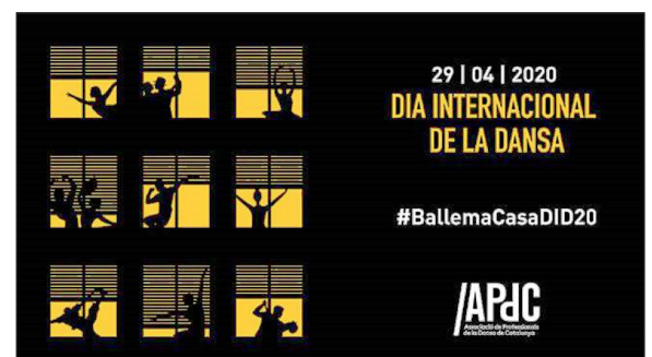
▲ Cartell del Dia Internacional de la Dansa

AQUEST ANY EL CONFINAMENT HO HA POSAT MÉS DIFÍCIL, PERÒ ELS AMANTS DE LA DANSA NO S'HAN DESANIMAT. S'HAN EMPESCAT FORMES PER PORTAR LA DANSA A CASA DE LA GENT GRÀCIES A LES XARXES SOCIALS. AIXÍ, HAN PENJAT TOTA MENA DE VÍDEOS DE BALLS DINS DE CASA I HAN ANIMAT TOT HOM A APRENDRE'S COREOGRAFIES.