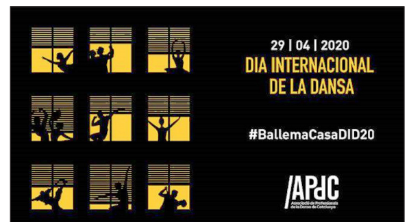
▲ Cartell del Dia Internacional de la Dansa

Aquest any el confinament ho ha posat més difícil, però els amants de la dansa no s'han desanimat. S'han empescat formes per portar la dansa a casa de la gent gràcies a les xarxes socials. Així, han penjat tota mena de vídeos de balls dins de casa i han animat tothom a aprendre's coreografies.