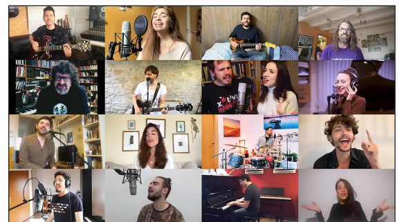
▲ Imatge del vídeo de la cançó Un Sant Jordi diferent

CI CM La diada de Sant Jordi és una festa de llibres i roses molt estimada a Catalunya. Però, és clar, aquest any no ha pogut celebrar-se com sempre. Amb el confinament, no hem pogut anar a les floristeries ni les llibreries, ni passejar entre parades al carrer. Així i tot, hi ha hagut algunes idees per poder celebrar Sant Jordi d'una altra manera.