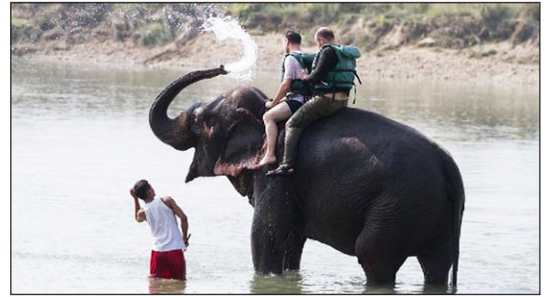
▲ Un elefant passeja dos turistes

CI Tailàndia és un país asiàtic que rep molts turistes. Solen visitar uns parcs on hi ha elefants. Aquests parcs han rebut moltes crítiques, perquè els animals pateixen. Els separen de les mares quan són petits, els domestiquen i els obliguen a passejar turistes sobre l'esquena o a fer espectacles d'acrobàcies.