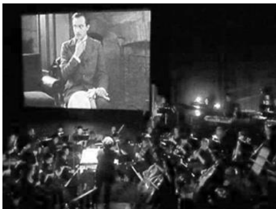
MÚSICA AL CINEMA MUT

El cinema és l'art de representar imatges en moviment en una pantalla. La música ha estat molt important dins del món del cinema, fins i tot quan aquest encara era mut: