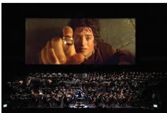
PEL·LÍCULA I BANDA SONORA