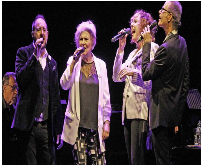
QUARTET VOCAL (The Manhattan Transfer)