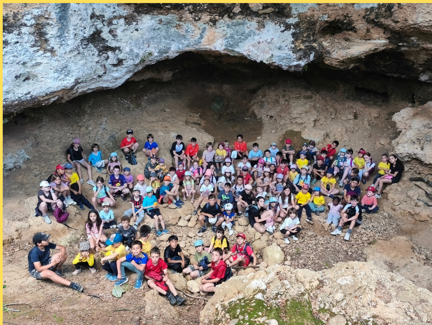
Alumnat de l'Escola Bora Gran a la Cova Bora Gran!

A més, hem fet una caminada solidària en col·laboració amb l'Ajuntament i el projecte Barris 10, i l'hem acabat amb tres curses d'orientació per Serinyà!