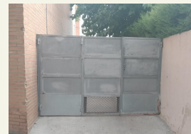
Porta Primària 2