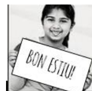
FOTO FI DE CURS