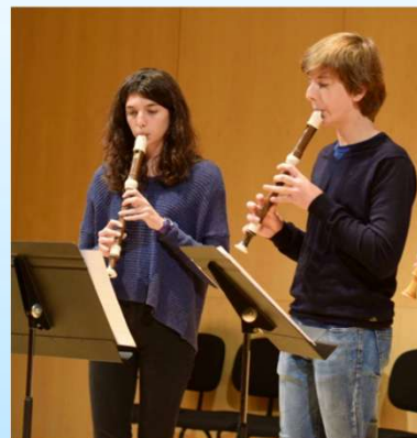
Flauta de bec