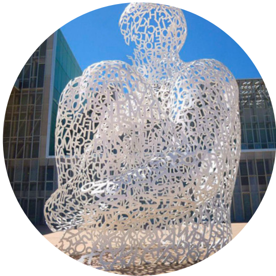
L'ÀNIMA DE L'EBRE

També seguirem dedicant estones al moviment i la dansa donant continuïtat a la proposta pedagògica del Projecte Onades.