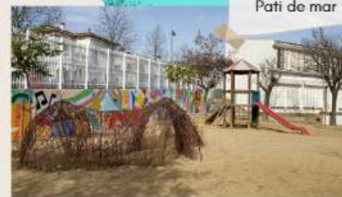
Pati de mar