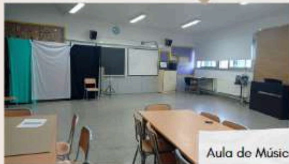
Aula de Música