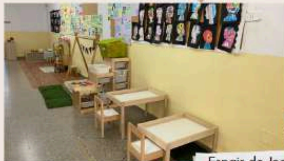
Espais de Joc i Treball