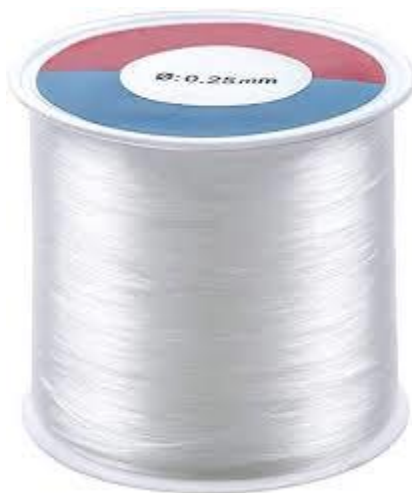
FIL DE PESCAR