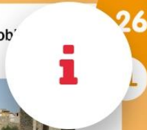
Can Mariner de sant Pau