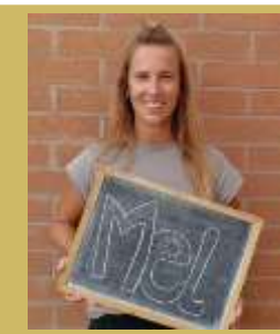
Psico I3 i I4: Mel