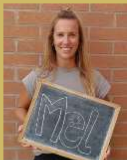
Cap d'estudis: Mel