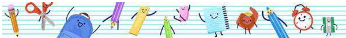
6è B. Yes Peregrina