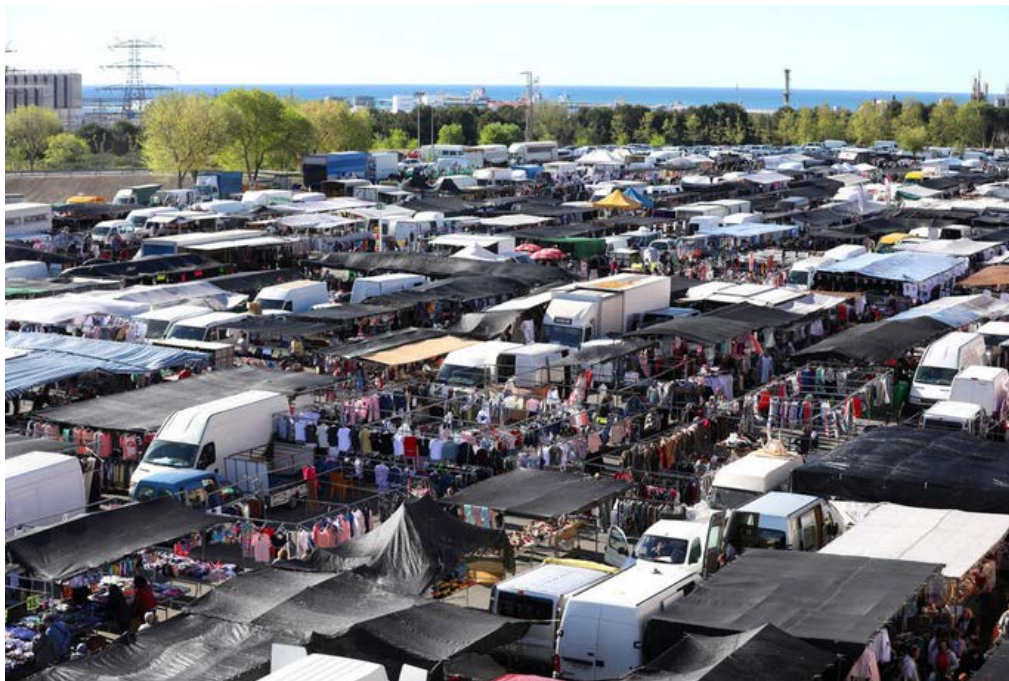
Una imatge del Mercat de Bonavista