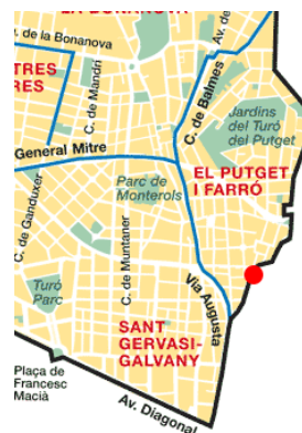
Mapa del districte i ubicació del nostre centre

Sarrià, l'altre centre neuràlgic del districte, manté la unitat del casc antic, tot i que d'aquest se separa el nucli de les Tres Torres per les seves característiques urbanes homogènies i l'alt grau de reconeixement que té per part dels seus habitants. Els altres dos barris són Putget-Farró i Vallvidrera- Tibidabo-les Planes. En els dos casos s'han unit petits nuclis de població per arribar a una xifra mínima d'habitants, ja que la majoria estan formats -per la seva condició muntanyenca- per zones de cases unifamiliars.