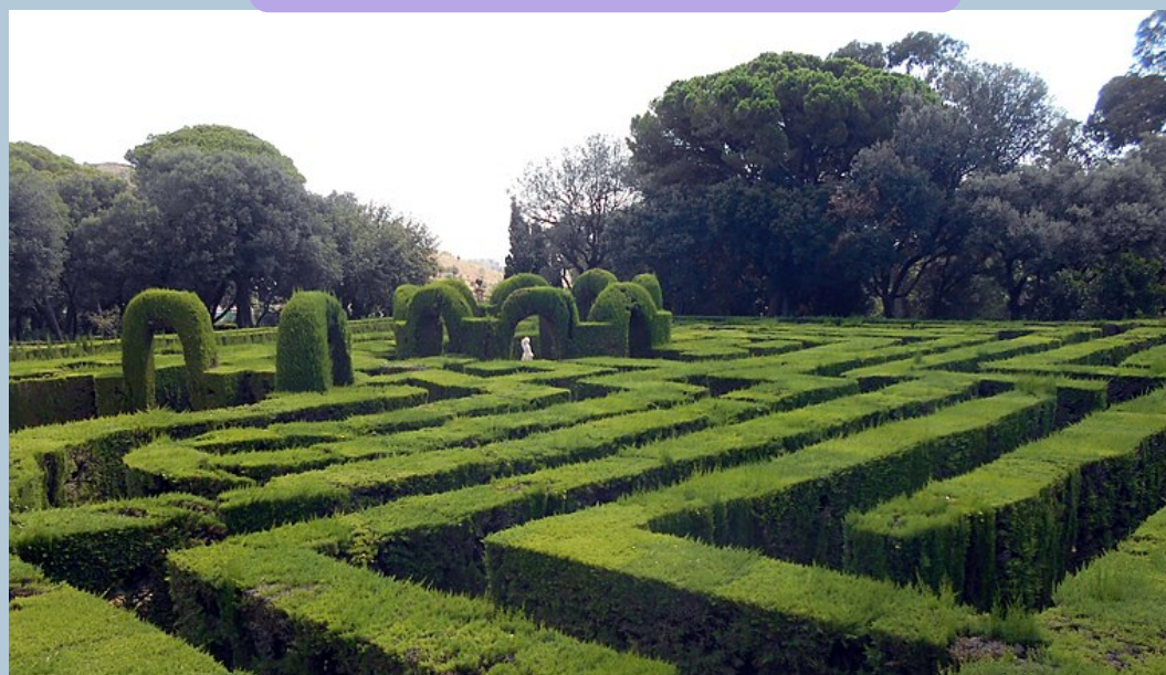
Parc del Laberint