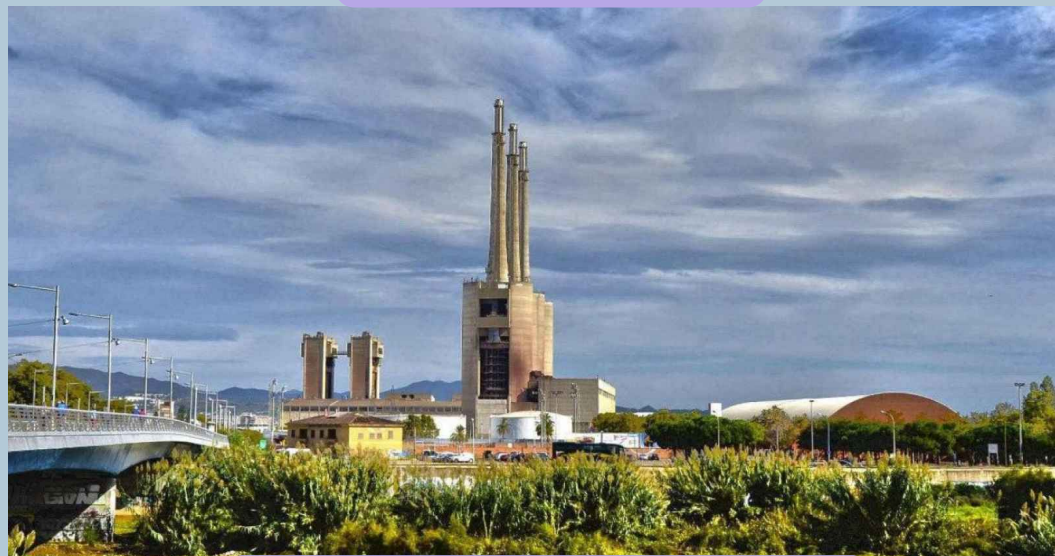
Desembocadura riu Besòs