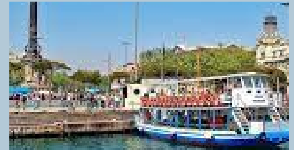
Passeig amb vaixell pel Port Vell

Passeig amb vaixell Las golondrinas 10h-12h