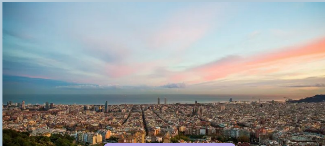
Turó de la Rovira