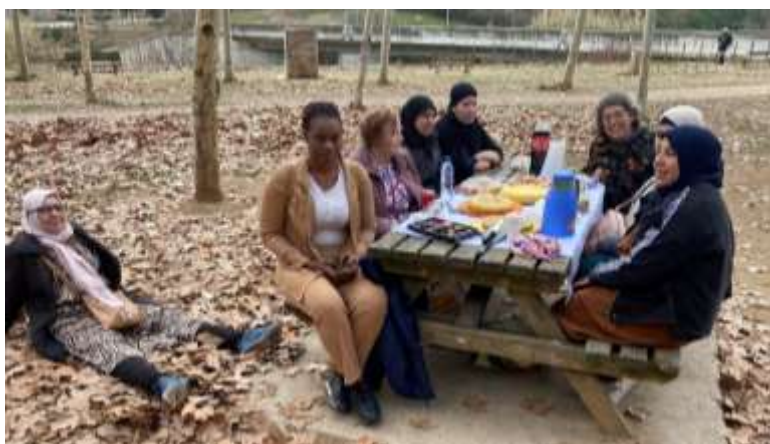
INSTRUMENTAL I TARDA CAN PUIGGENER