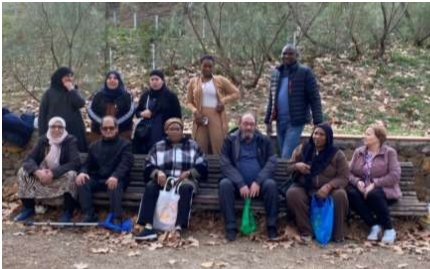
INSTRUMENTAL II TARDA CAN PUIGGENER

En resumen, nos gustó mucho porque hablamos, bromeamos y nos reímos todos juntos.