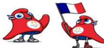
COBI (BARCELONA 1992) VINICIUS (RIO DE JANEIRO 2016) MASCOTES DELS JOCS OLÍMPICS A PARÍS 2024