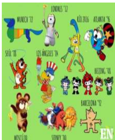
LES MASCOTES OLÍMPIQUES DES DEL 1980 FINS EL 2024