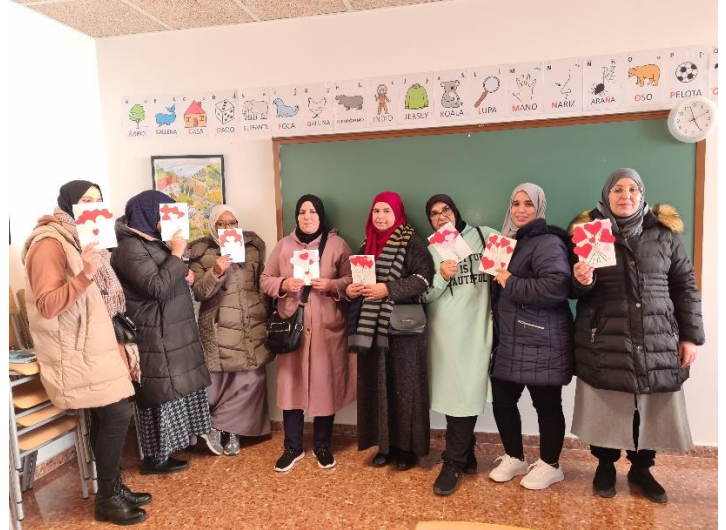
INSTRUMENTAL I i II – CAN DÉU