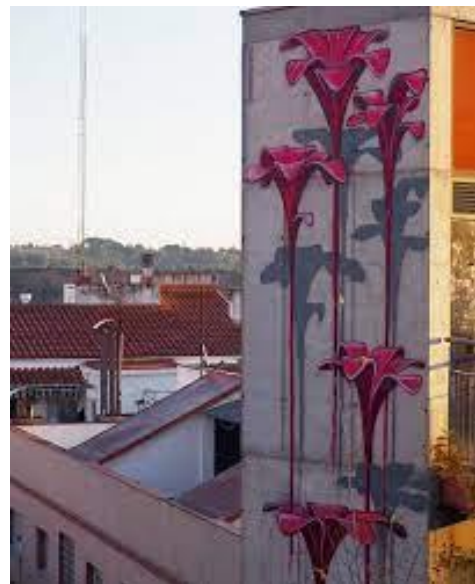
Grafitis de l'artista sabadellenc Werens