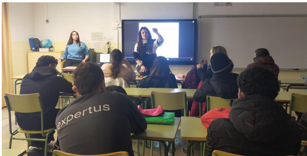
GES TARDA i VESPRE

Els membres de l'Oficina Jove de l'Ajuntament de Sabadell va oferir una xerrada sobre micromasclisme i les violències de gènere.