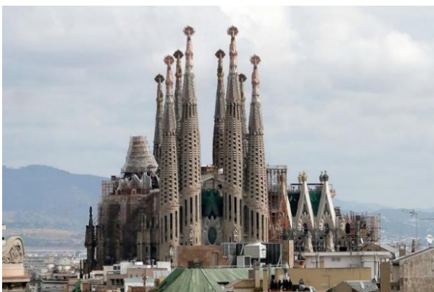
INSTRUMENTAL I i II – CAN DÉU

Un tattoo es para recordar y grabar en tu piel algo que te ha marcado en tu vida, te lo marcas también en tu piel.