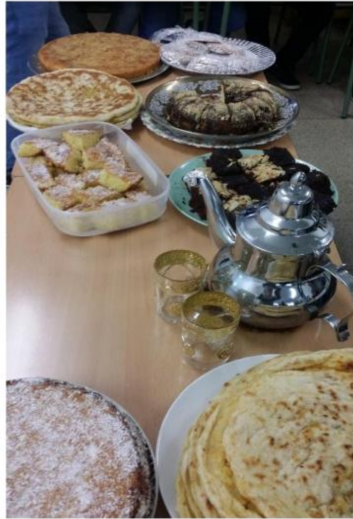
Pasteles de la fiesta de la Castanyada en Can Puiggener