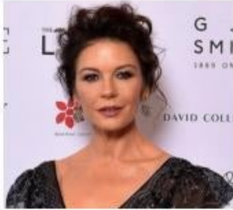
Catherine Zeta Jones