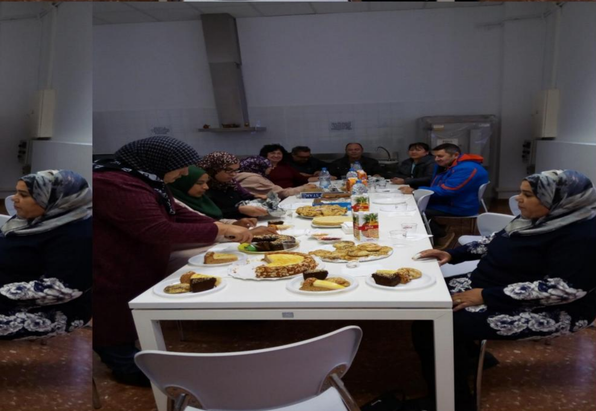
Alumnes d'Instrumental I i Competic de Can Deu celebrant la Castanyada.