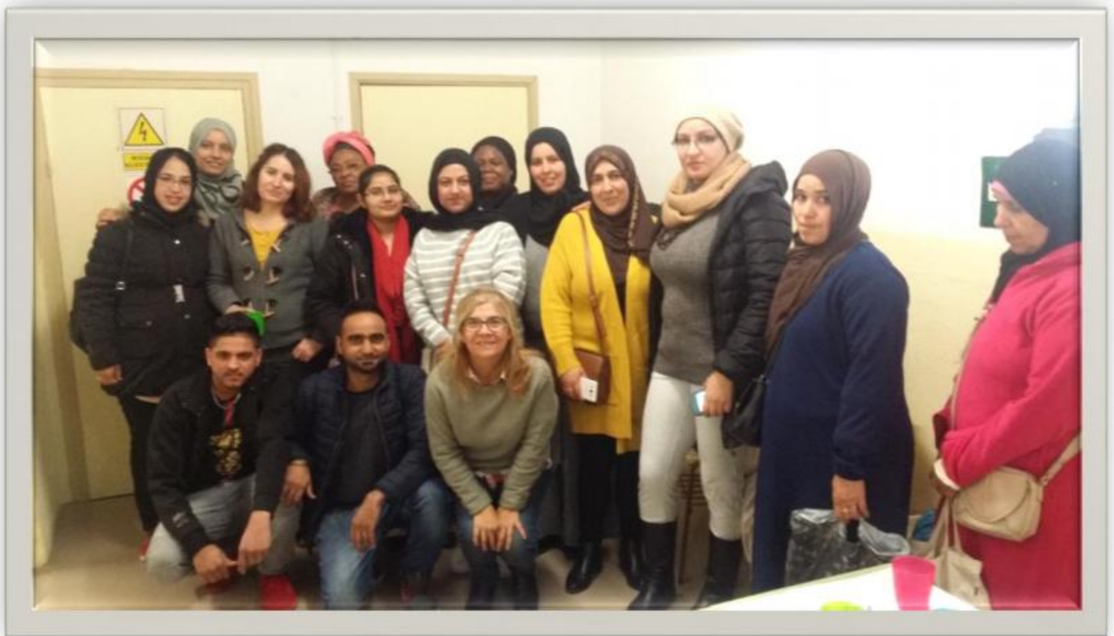
Alumnos y profesores de Concordia, Fiesta de la Castanyada mañana.