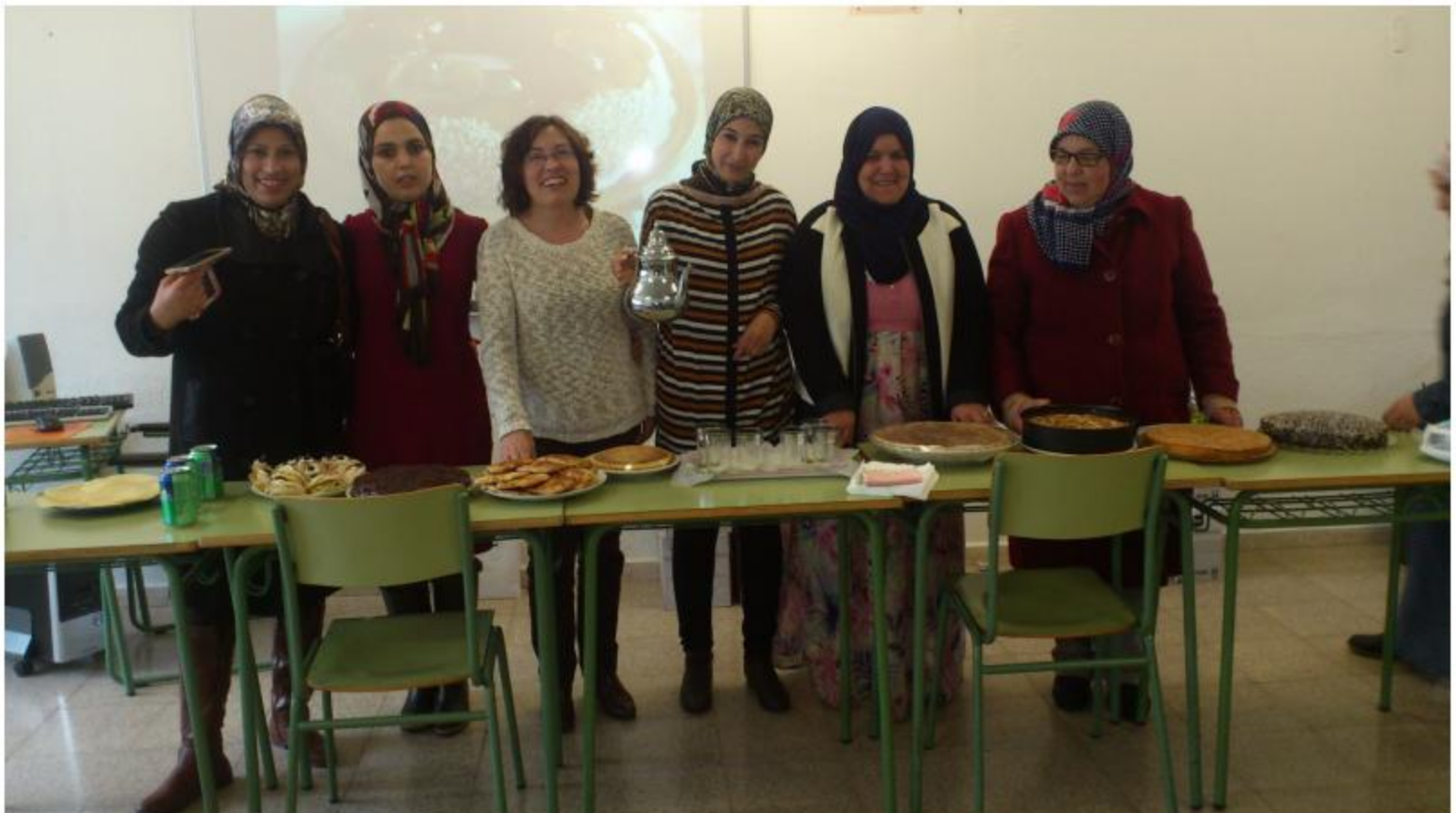
Un delicioso té de Marruecos

Me gusta visitarla porque es alegre y el aire es limpio. Hay siempre muchos turistas y es muy famosa.