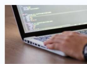
Desenvolupament d'aplicacions web