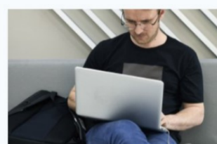
Administració de sistemes informàtics en xarxa