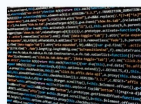
Desenvolupament d'aplicacions multiplataforma