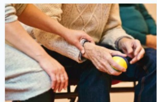
Atenció a persones en situació de dependència