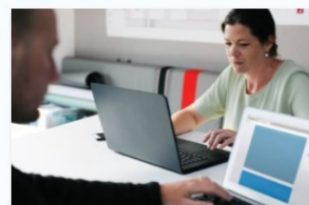
Assistència a la direcció