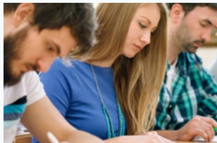
Curs de preparació per la prova d'accés a CFGS