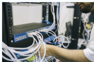
Sistemes microinformàtics i xarxes