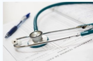
Cures auxiliars d'infermeria