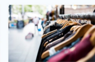
Gestió de vendes i espais comercials