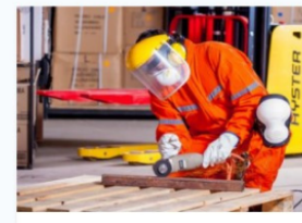
Prevenció de riscos professionals