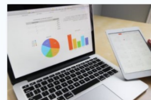
Administració i finances