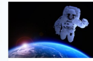
Animacions 3D, jocs i entorns interactius

REQUISITS • Títol d'ESO o GES o FP 1 • Titulació ORIGINAL • DNI o Passaport VIGENT