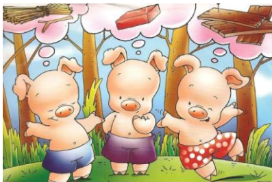
Una vegada hi havia tres porquets que volien fer-se una caseta al bosc. Un la faria de palla, l'altre de fusta i l'altre de totxo.