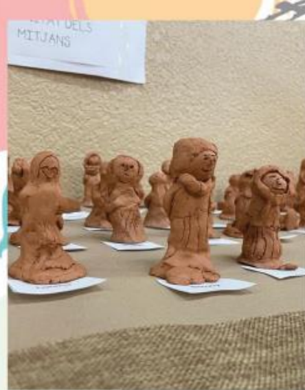
Exposició Escultures Soriano - Montagut