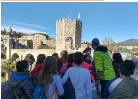
Colònies cicle mitjà "Aventura a la muntanya"