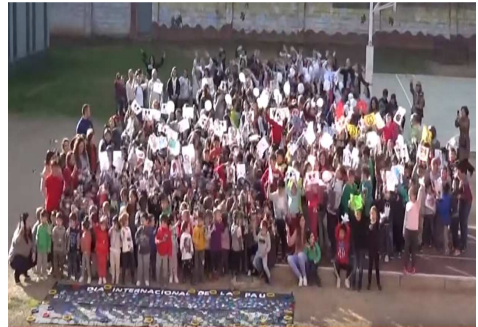
Dia de la Pau i la no-violència