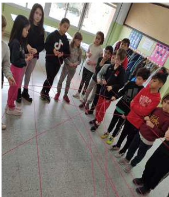
Treball de relacions socials