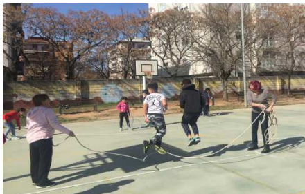
Jocs tradicionals amb el Casal d'avis del barri