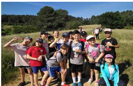
Sortida conjunta (Collserola)