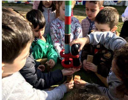
Jornades: "El món del joc"