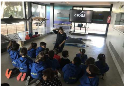
Projecte Animals marins (CRAM)

Entenem el treball per projectes com l'oportunitat de posar en pràctica aquelles capacitats i competències apreses en situacions reals d'aprenentatge, contextualitzades i més motivadores pels alumnes.