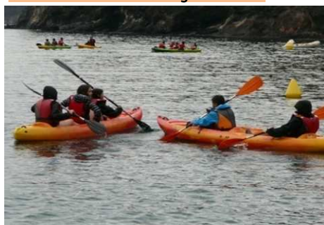
Colònies cicle superior "Esports a Cala Montjoi"