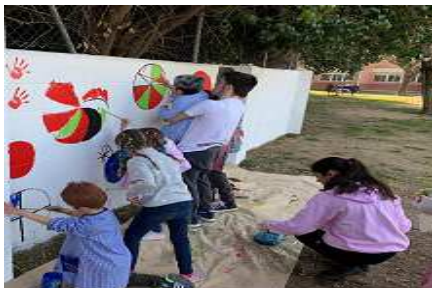
Pintem el Pati amb els alumnes del Mimó