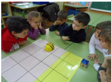
Robòtica (Bee-bots a P3)

Integrem les noves tecnologies en els processos d'aprenentatge dels nostres alumnes. L'escola disposa de recursos suficients per a assolir aquesta fita: aula d'informàtica, 2 aules mòbils amb vint-i-quatre ordinadors portàtils, pissarres digitals i ordinadors a totes les aules amb connexió a la xarxa, WIFI a tota l'escola i d'altres mitjans audiovisuals i informàtics.