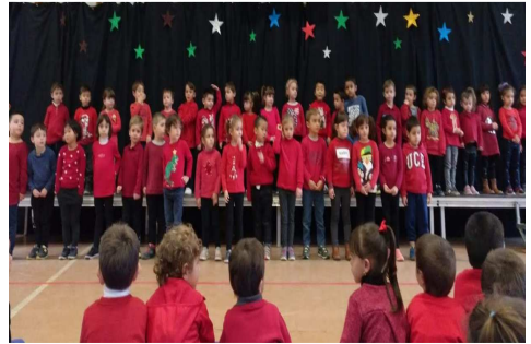
Concert de Nadal