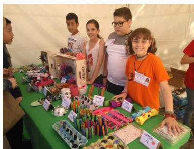
Mercat de cooperatives escolars