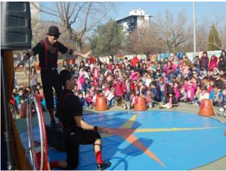
Jornades: "La vida al circ"

Organitzades per l'escola i l'AMPA, conjuntament. Pretenen reflexionar sobre diferents aspectes educatius dels nostres fills i filles i, a la vegada, fomentar la convivència entre tota la comunitat educativa.