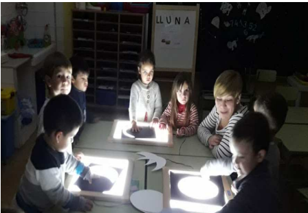
Treball per projectes. Com és la lluna?