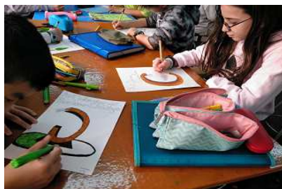
Art interchange BCN-Chicago