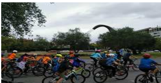
Bicicletada dels Camins escolars