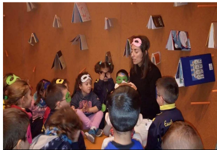
Sortida al MACBA (Barcelona)