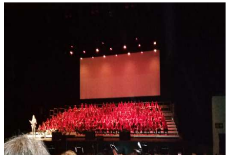
Cantània (Auditori de Sant Cugat)