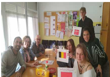
Practicants projecte Get connected