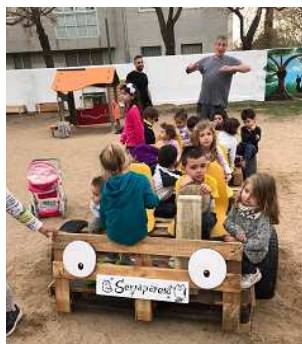
Jornada de patis