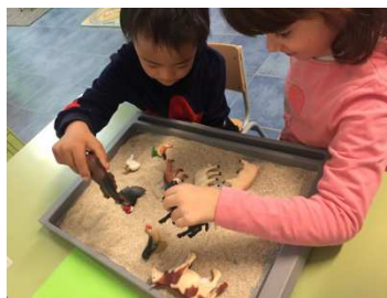
Treball Aula SIEI