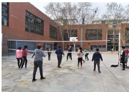
Trobada esportiva Institut Banús