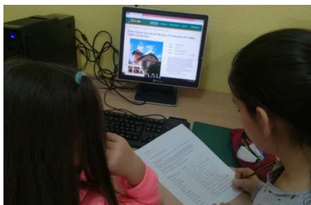
Aula TAC. Recerca d'informació