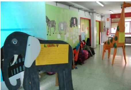
Sant Jordi. Bestiari poètic