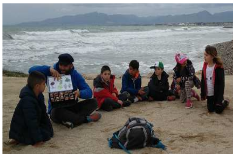
Colònies cicle inicial "Coneguem el mar"