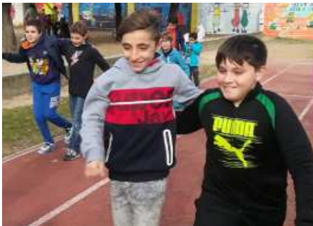
Dia Internacional de les persones amb Discapacitat