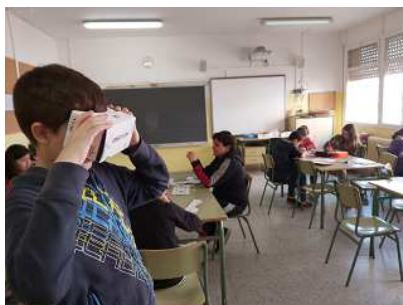
Taller Realitat Virtual/Realitat Augmentada