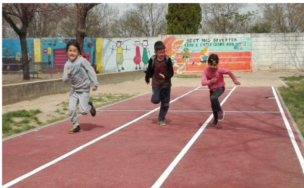
Pista d'atletisme de l'escola