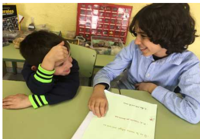
Padrins i fillols