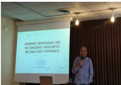
Xarxa XIEP (jornada inaugural)