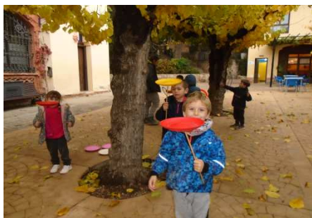
Colònies educació infantil a "El circ"

A més, són un excel·lent moment per fomentar les relacions entre alumnes i professors.