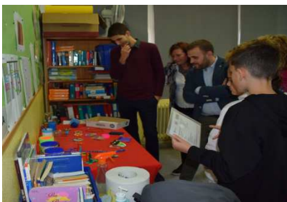
Entrega del NIF

Projecte d'innovació per al foment de la competència d'emprenedoria i iniciativa personal a través de la creació i la gestió d'una cooperativa a l'escola, reforçant l'aprenentatge transversal del currículum, l'adquisició de les competències bàsiques i les actituds de cooperació dins la comunitat educativa.