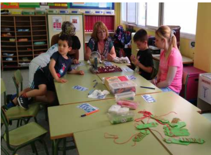
Activitats amb famílies (racons de llengua)