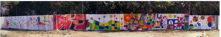
Jornades: "L'art contemporani"