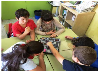
Interessos dels infants