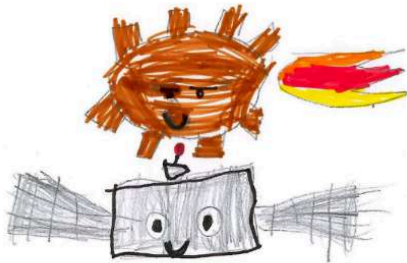
RANITA (CATEGORIA INFANTIL-CICLE INICIAL).

TEMPS ERA TEMPS QUAN ELS ANIMALS PARLAVEN I LES PERSONES CALLAVEN HI HAVIA UN SATÈL·LIT QUE ESTAVA MOLT CONTENT, PERÒ ESTAVA MOLT SOL. UN DIA ES VA ADONAR QUE HAVIA PERDUT UN BRAÇ, PERÒ HI HAVIA UN METEORIT QUE VA TROBAR UN BRAÇ I LI VA TORNAR AL SATÈL·LIT. CONTE CONTAT, SI NO ÉS MENTIDA ÉS VERITAT.