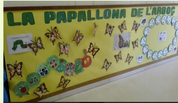
LA PAPALLONA D'ARBOÇ