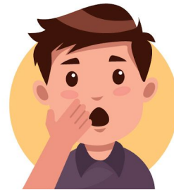
Control de símptomes