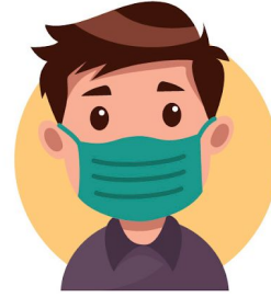
Ús de mascareta