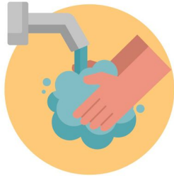
Higiene de mans