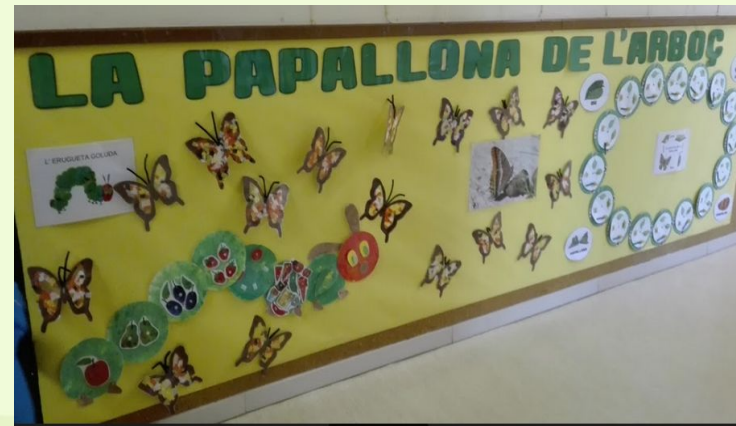
LA PAPALLONA D'ARBOÇ