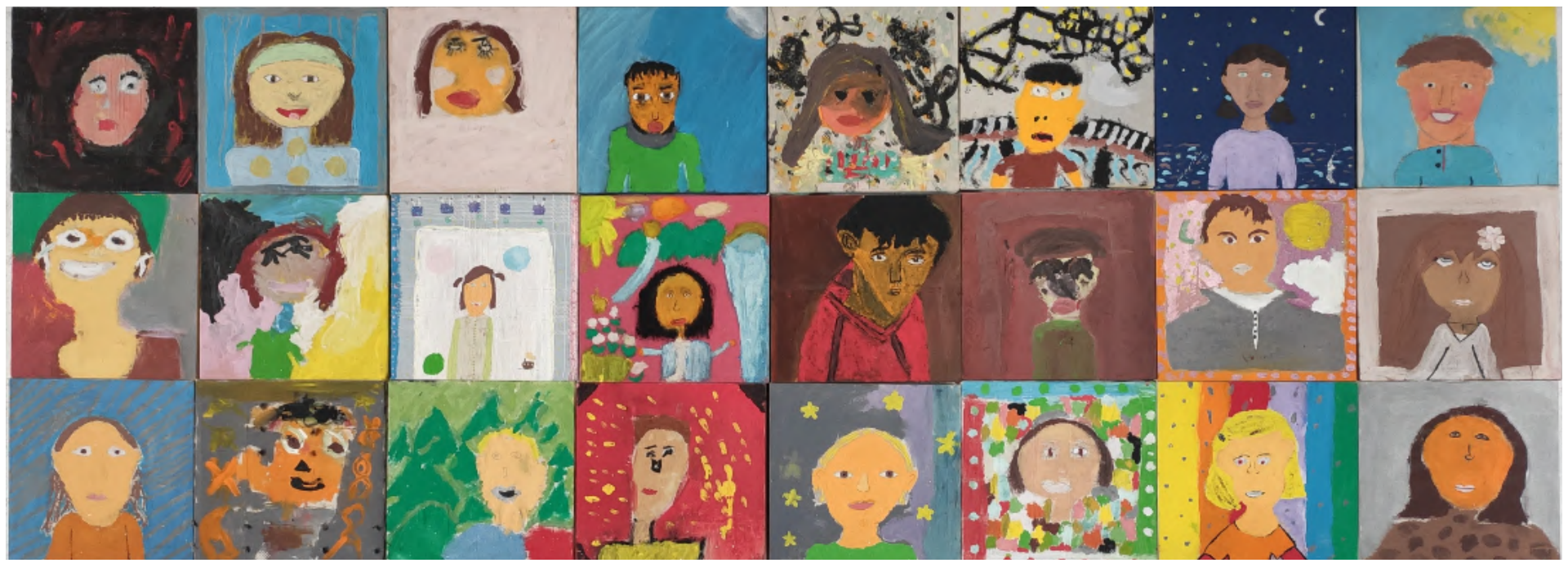
Autoretrats elaborats per l'alumnat que va estrenar l'edifici de l'escola Riera de Ribes. Curs 2004-2005