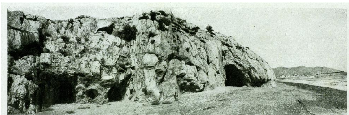
Il·lustració 1. Antiga imatge de Cova del Gegant. Sitges es veu al fons a la dreta.

https://www.eixdiari.cat/cultura/doc/88539/identifiquen-a-sitges-lus-de-coves-per-part-del-linx-iberic-durant-la-prehistoria.html?utm_source=Butlletins+Eix+Diari&utm_campaign=8464fb440f-butlleti_titulars_COPY_01&utm_medium=email&utm_term=0_c8e6ecb022-8464fb440f-28319838