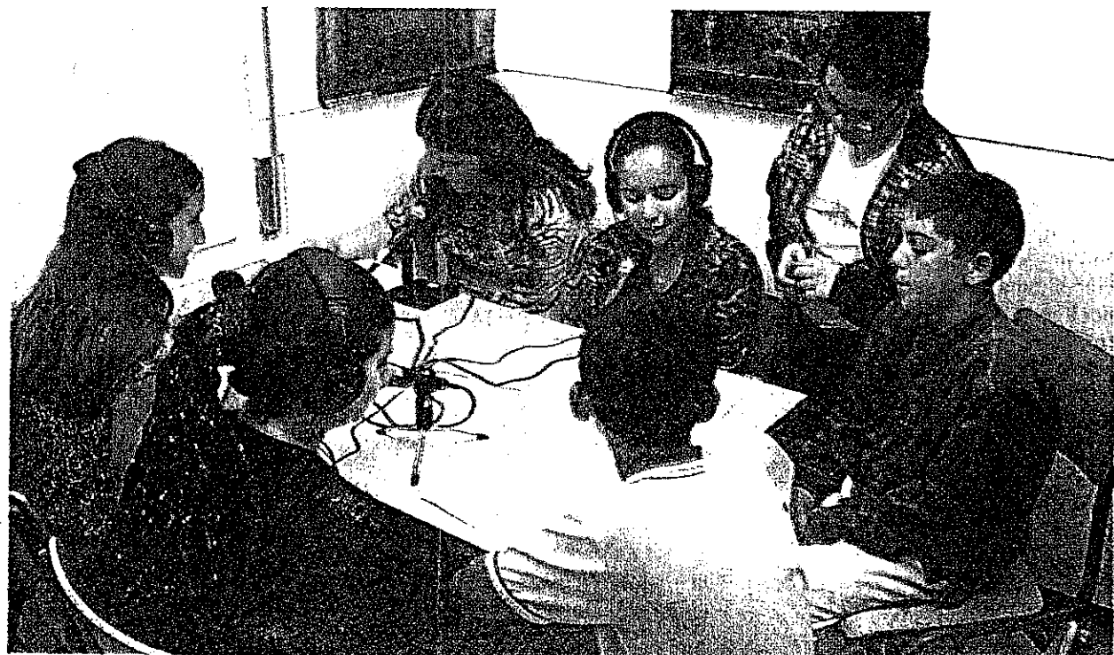
Alumnos del centro ante los micrófonos de la nueva radio

Ona Lectiva es el nombre de la primera emisora de radio escolar que funciona en Terrassa. La primera emisión oficial se llevó a cabo ayer, durante un acto de inauguración que incluyó una entrevista en directo al alcalde, Pere Navarro, por parte de cuatro alumnas de sexto de primaria. La emisora funcionará, por el momento, los jueves por la tarde y se puede sintonizar en el 97,1 de la FM. Su cobertura es de unos tres kilómetros desde el centro emisor, en el locutorio instalado en el mismo colegio, desde el que podrán aportar ideas tanto alumnos como profesores y padres. PÁGINA 10