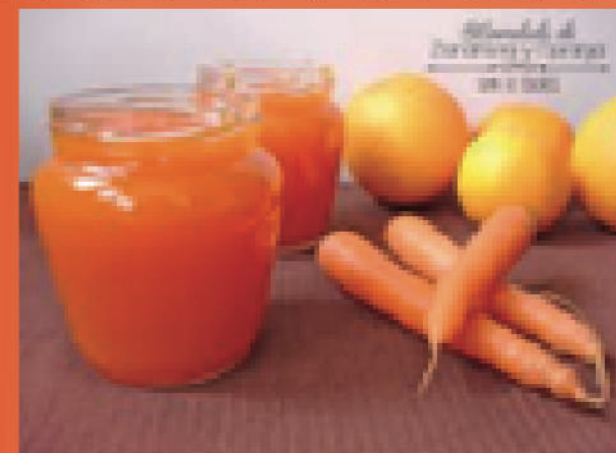
MELMELADA DE PASTANAGA

DEMANA AJUDA A LA TEVA FAMÍLIA. ET DONEM ALGUNES IDEES I RECEPTES: MELMELADES, MEL I TORRADES, SUC DE TARONJA, BEGUDES REFRESCANTS AMB MENTA... MMMM