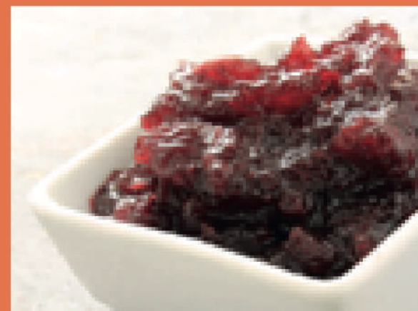
MELMELADA DE FRUITA