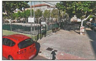
E S T A T A C T U A L