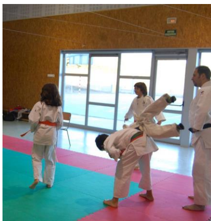
Classes extraescolars de judo.