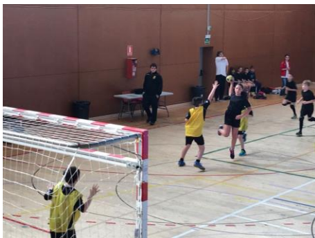
Classes extraescolars de handbol.