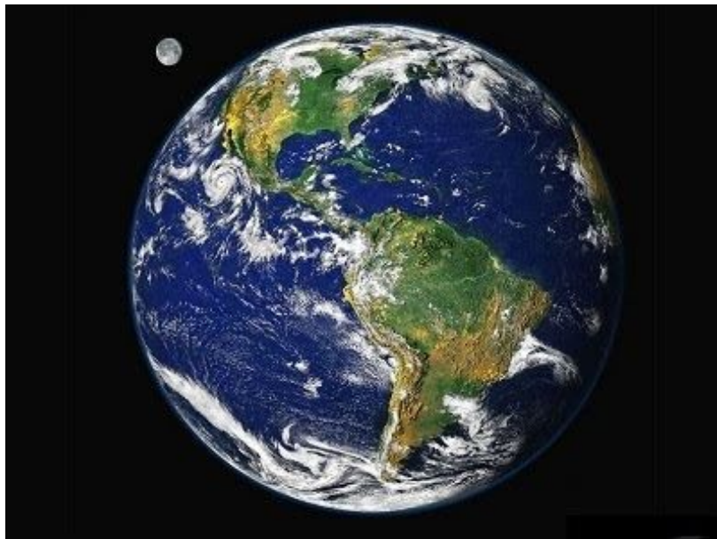
Qüestionari sobre la Terra.

Aquesta vegada toca repassar els conceptes que hem après les setmanes anteriors. Per això us hem preparat aquest qüestionari en línia. Haureu de posar el nom i el vostre grup (5A, 5B, 5C o 5D).