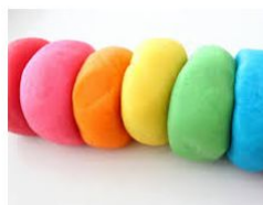
BOLETES DE PLASTILINA

Si no en teniu la podeu fer: farina, aigua i una mica d'oli. Per donar color hi podeu posar colorant.