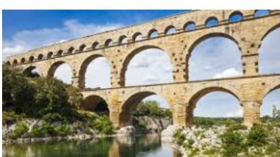
Arcs d'un aqüeducte

Alguns dels invents romans més importants són: les carreteres, l'arc (per fer ponts i aqüeductes), els sistema de clavegueram subterrani o els molins d'aigua. Invents que encara avui es fan servir arreu del món.