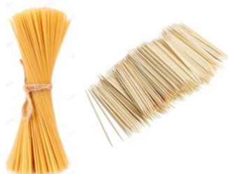
Algun material allargat i rígid

Material: Un joc de construcció o aquí us deixem una possible alternativa.