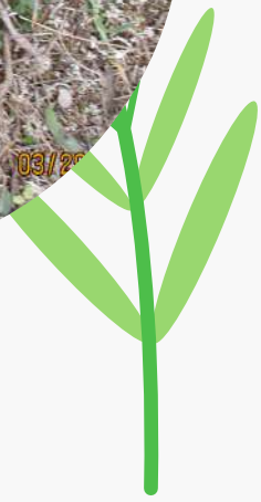
Fotografies realitzades pels infants