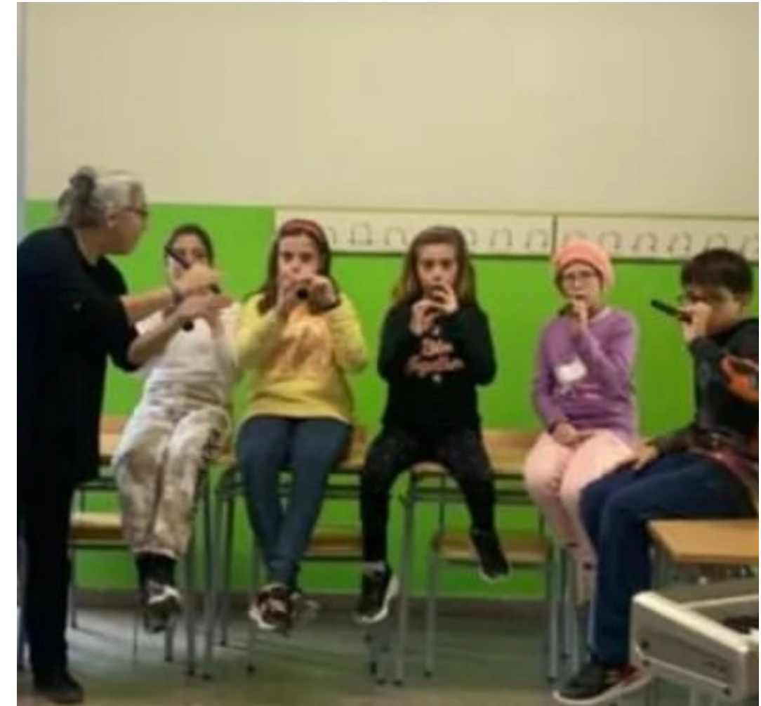
FLABIOL I GRALLA