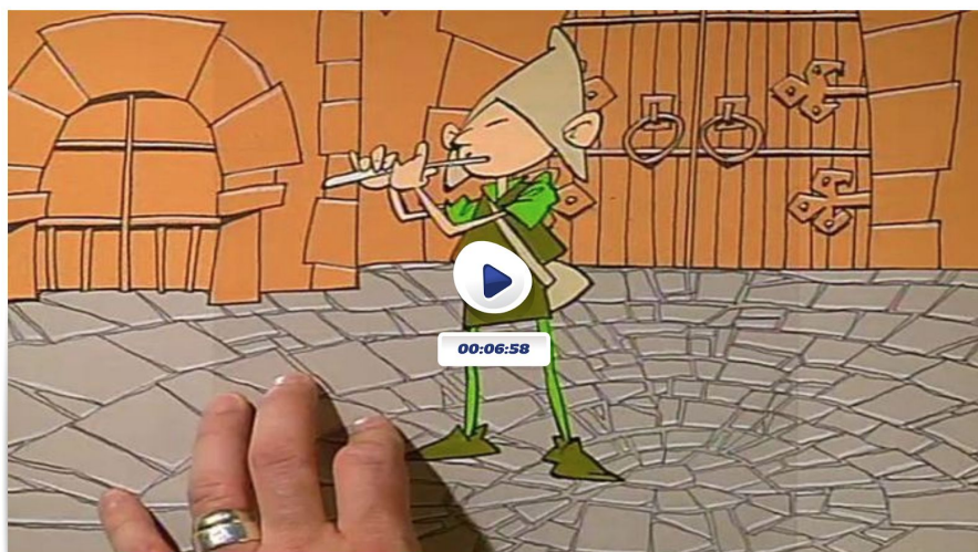
El flautista d'Hamelín

https://www.ccma.cat/tv3/super3/contes-classics/el-flautista-dhamelin/coleccio/14070/4570692/