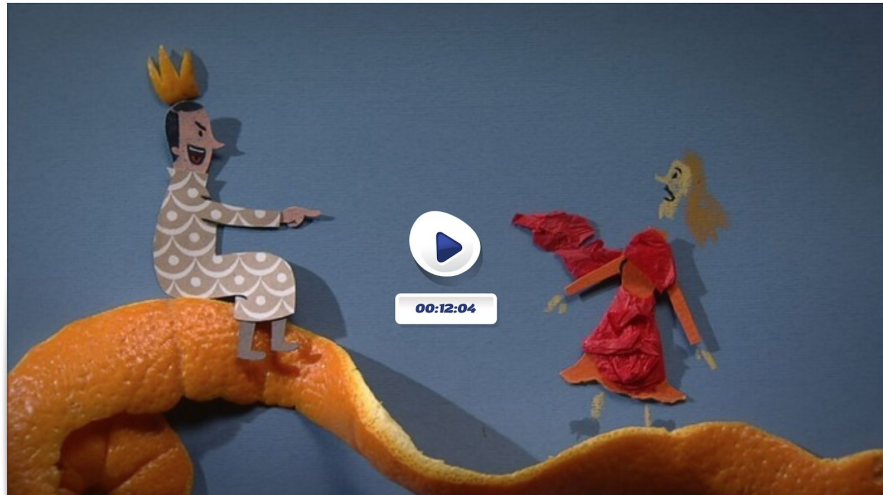
El rei burleta

https://www.ccma.cat/tv3/super3/una-ma-de-contes/el-rei-burleta/video/5787376/