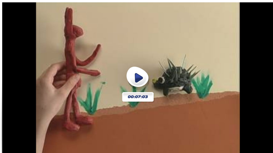
La llebre i l'erico

https://www.ccma.cat/tv3/super3/contes-danimals-magics/la-llebre-i-lerico/coleccio/14250/5507211/