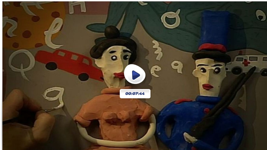
El soldadet de plom

https://www.ccma.cat/tv3/super3/una-ma-de-contes/el-soldadet-de-plom/video/860079/