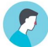
PÉRDIDA DEL SENTIDO DEL OLFATO