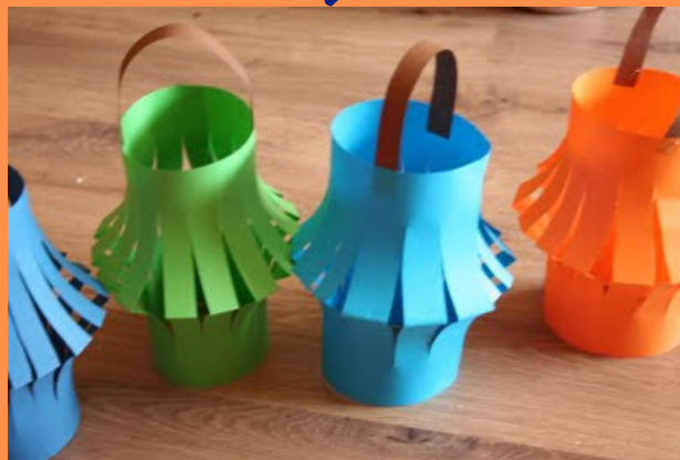
COM FER FANALETs