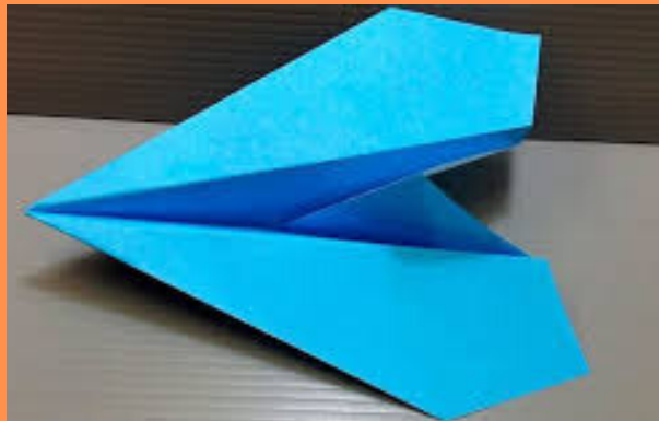
COM FER AVIONS