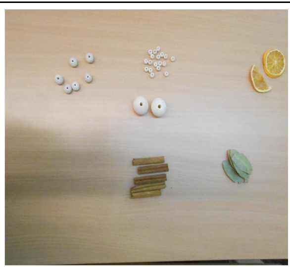
BOLETES DE DIFERENTS MIDES