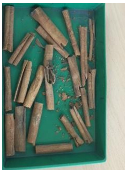
TRONCS DE CANYELLA