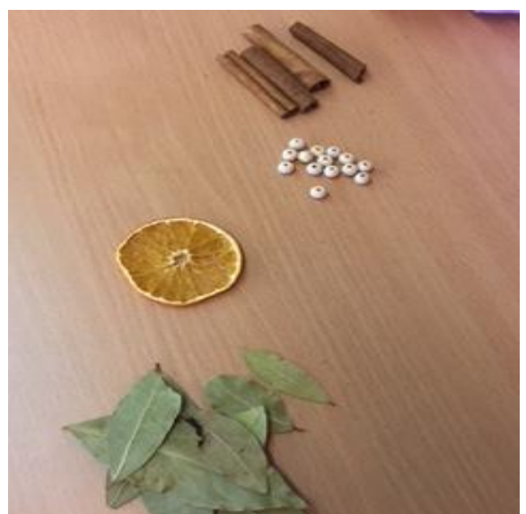
TARONJA, FULLES SEQUES I CANYELLA