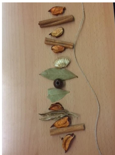
FLORS I FULLES