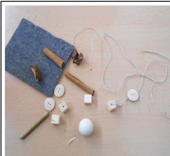
FILS, BOTONS I CUBS.