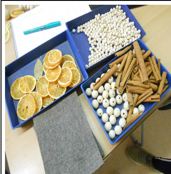
BOLES DE DIFERENTS MIDES I FELTRE