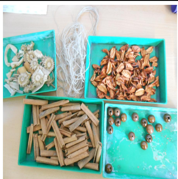
SAFATES, FLORS I FULLES