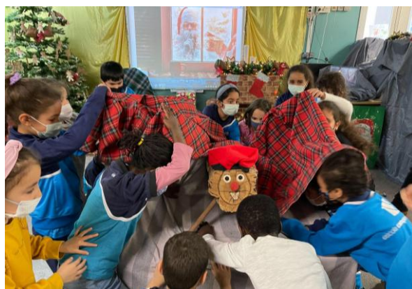
Alumnes buscant el que havia cagat el Tió