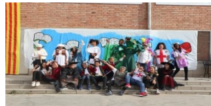
Llegenda de Sant Jordi (teatre 6è)

El divendres 22 d'abril es va celebrar el dia de Sant Jordi. Tota l'escola vam fer balls i els alumnes de sisè van fer una obra de teatre.