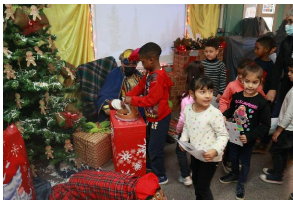
Alumnes emocionats en rebre el Patge Reial i entregant les seves cartes