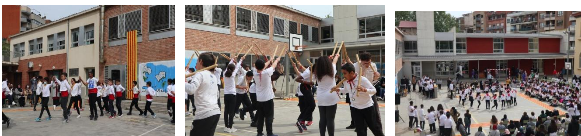
Exhibició de danses populars catalanes (Ball de Cercolets, Ball de Bastons, sardanes...)

El divendres 22 d'abril es va celebrar el dia de Sant Jordi. Tota l'escola vam fer balls i els alumnes de sisè van fer una obra de teatre.