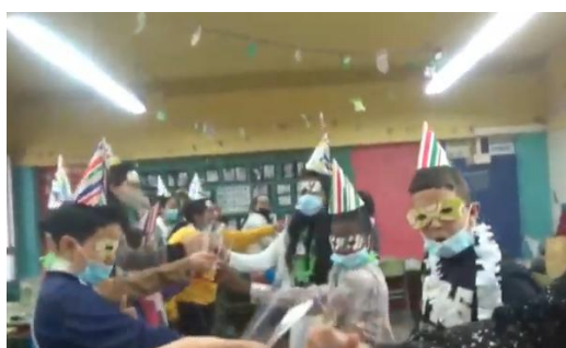
Alumnes ballant durant la gravació