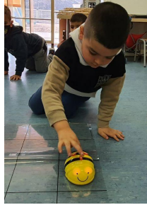
Ús de tecnologies