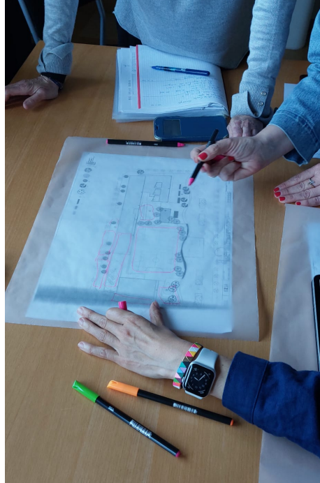
Primera sessió entre AFA i escola per marcar les diferents zones del pati

Simultàniament a aquest treball, també s'està elaborant un projecte des de l'AFA perquè l'Ajuntament, com a ens local, pugui demanar una subvenció d'Acció Climàtica (2023-2025) per adequar el pati de l'escola. Aquesta es presentarà a juliol 2023 i consistirà en augmentar la zona verda per millorar les condicions tèrmiques i de confort del mateix (s'incrementen zones d'ombra que també milloren la humitat ambiental).